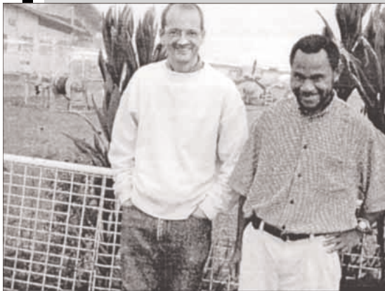
Tällä hetkellä lopettelen Azusan Tyynenmeren Yliopiston MA-opinto-ohjelmaa. Tämä on auttanut meitä valtavasti elämässämme!